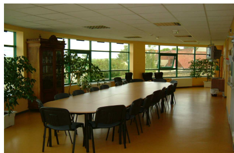
La salle de réunion