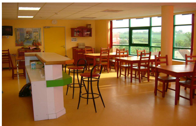
La salle à manger et la cafétéria