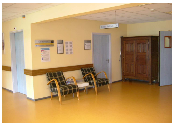
Le hall d'accueil