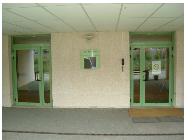
L'entrée du service

Centre Hospitalier Marguerite de Lorraine Secrétariat du service " Les Sources " 9, rue de Longny 61400 MORTAGNE AU PERCHE Tél : 02.33.83.40.43 Fax : 02.33.83.40.59